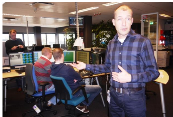
Reinier Van Den Berg - meteoroloog en TV presentator

Het is bijvoorbeeld niet ondenkbaar dat er in het noordoosten van het land sneeuw valt terwijl het in het zuiden helemaal droog blijft met wat zonneschijn. Vandaar de behoefte om toch over al die gegevens te kunnen beschikken.